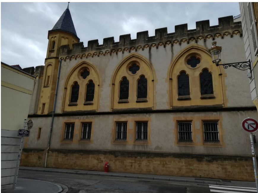
Doc René Klein