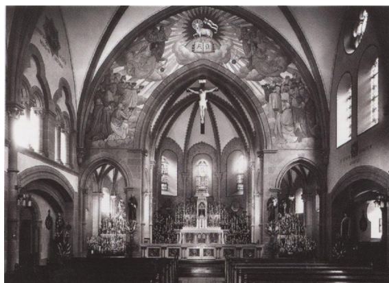
Vue intérieure Extrait de «l'Histoire de Sainte-Blandine» Gérard Léonard †

Samedi 4 décembre 2021 de 9h à 18h Amphithéâtre de l'Institution Jean-Baptiste de la Salle 2 rue Saint-Maximin METZ (stationnement gratuit dans la cour, rue Devilly)